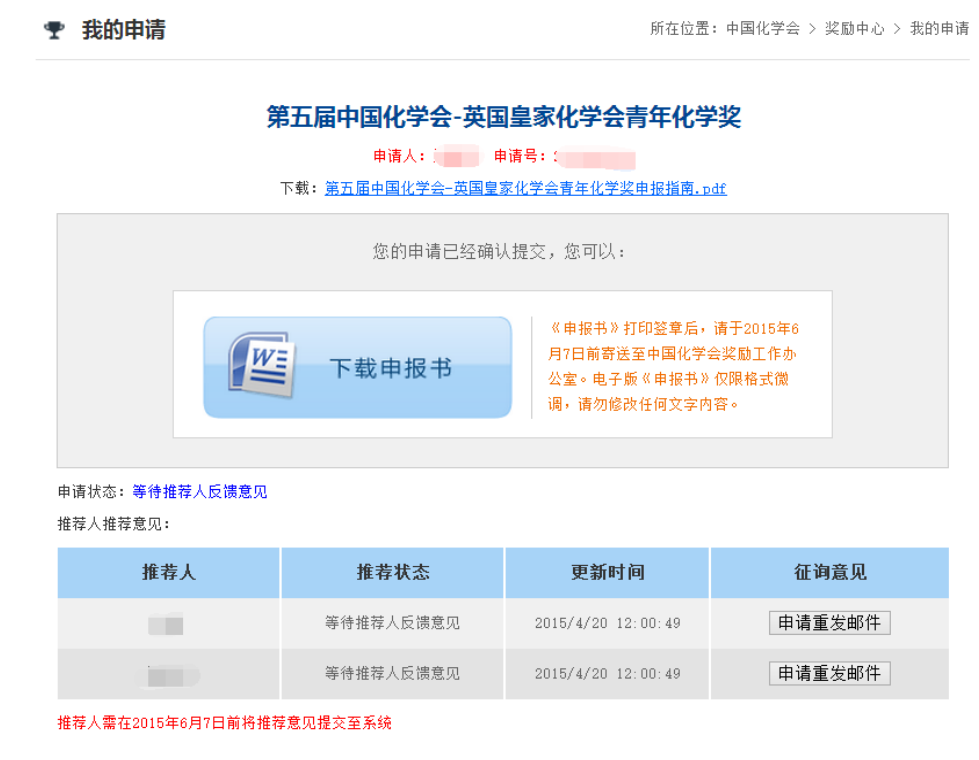
图 9 提交申请成功页面

当提交奖励申请成功后，页面将自动跳转至“我的申请”，点击“下载被推荐人信息表”，导出申请人的《被推荐人信息表》DOC 文件（图 9）。导出后的被推荐人信息表只可修改格式，内容需与电子版保持一致。