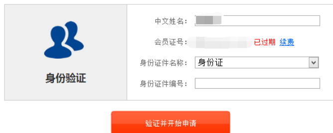
图 4 个人会员过期提示