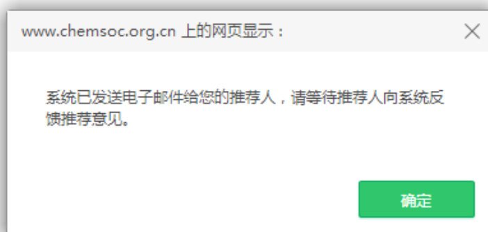
图 17 发信提示页面

当申请人确认提交申报信息后，系统将自动给每位推荐人发送推荐邀请（图 17）。推荐人可根据实际情况同意或拒绝推荐。申请人可以通过“我的申请”查看推荐状态及推荐意见反馈情况。