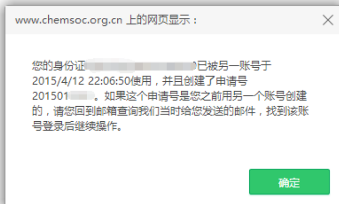
图 7 重复申报奖励提示页面

提示： 非中国化学会会员需先办理入会手续，成为个人会员后，再申报学会奖励。忘记会员证号的申请人可登陆个人会员中心，查看会员证号。如果忘记登录密码，可通过注册时的 Email 和姓名重置密码。