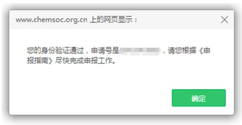
图 3 身份验证成功并获得申请号

如果点击“验证并开始申请”后，页面显示“已过期续费”（图 4），表示申请人的会员身份已经过期。可先缴纳会员费，成为有效个人会员后，再行申报（图 5）。