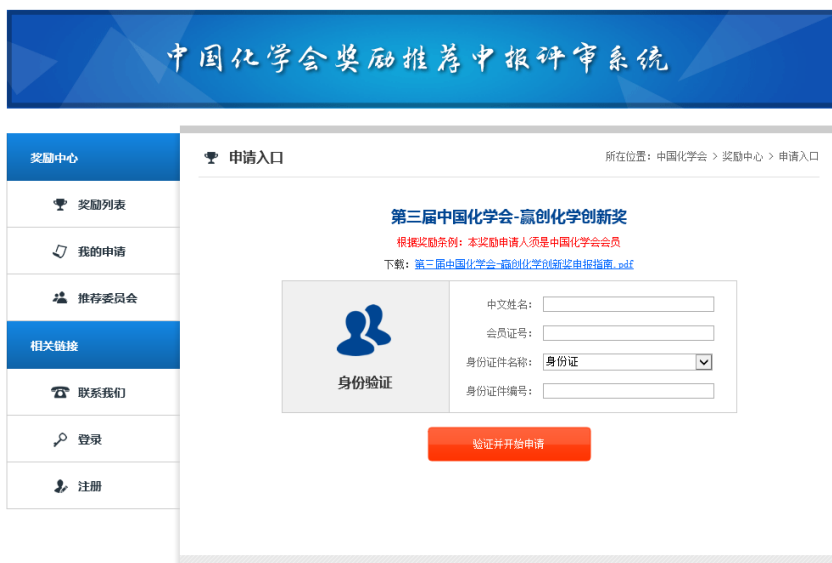
图 2 身份验证页面