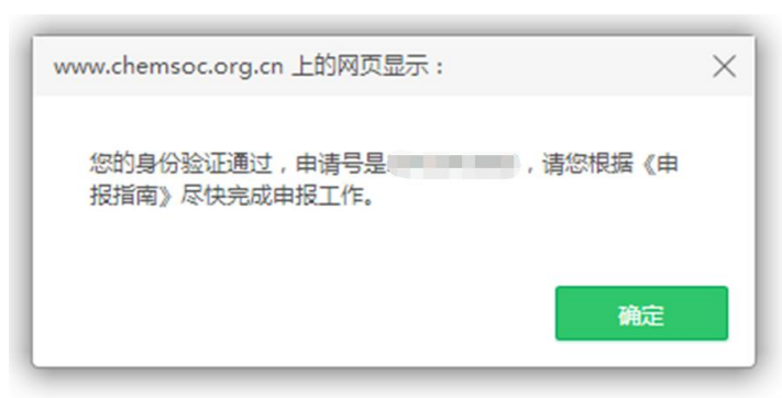
图 3 身份验证成功并获得申请号

如果点击“验证并开始申请”后，页面显示“已过期续费”（图 4），表示申请人的会员身份已经过期。可先缴纳会员费，成为有效个人会员后，再次申报。