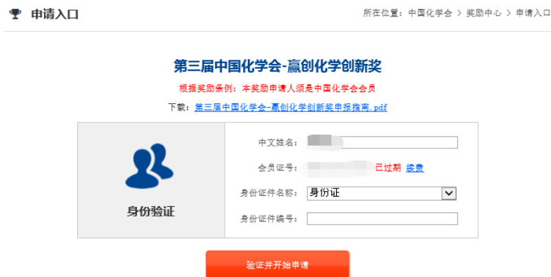
图 4 个人会员过期提示

如果点击“验证并开始申请”后，页面显示“已过期续费”（图 4），表示申请人的会员身份已经过期。可先缴纳会员费，成为有效个人会员后，再次申报。