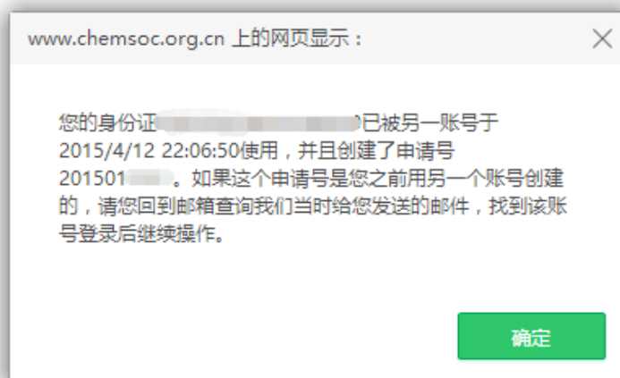
图 7 重复申报奖励提示页面