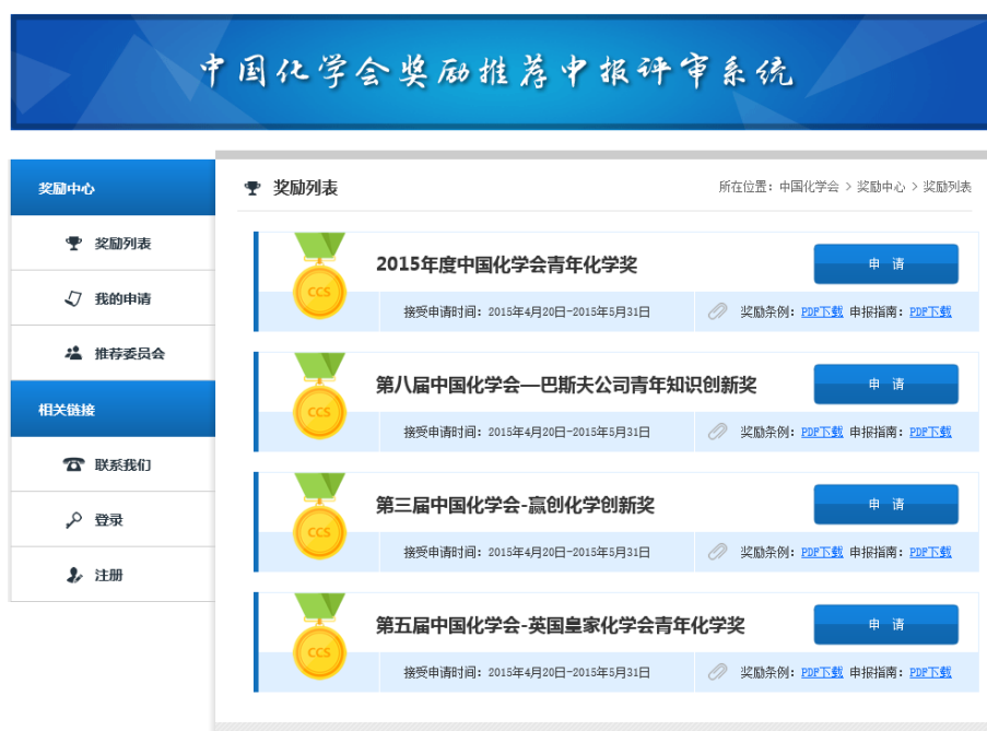
图 1 奖励申报页面

选择拟申报奖励，点击下载“奖励条例”和“申报指南”，仔细阅读并准备好相关材料后，点击“我要申请”（图 1）。