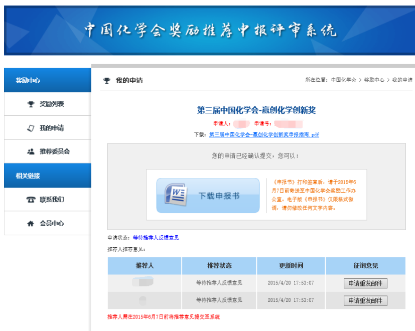
图 9 提交申请成功页面

申请人提交奖励申请后,可通过个人账号登陆中国化学会奖励推荐申报评审系统,通过“我的申请”查看推荐人《推荐意见》反馈状态。如果推荐人在临近推荐截止日期(2017年6月25日)前没有提供推荐意见,申请人可点击“申请重发邮件”提醒推荐人反馈推荐意见。